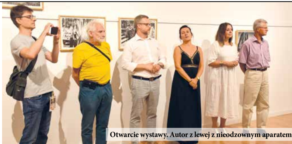
Otwarcie wystawy. Autor z lewej z nieodzownym aparatem

W latach osiemdziesiątych wielu Polaków prze-