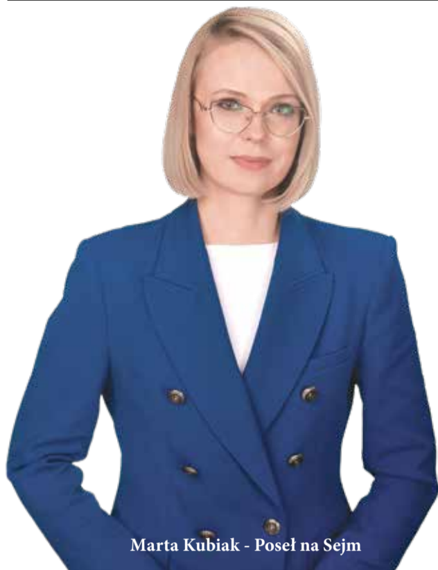
Marta Kubiak - Poseł na Sejm

1 lipca ruszył program „Profilaktyka 40 plus” z równoczesnym zniesieniem limitów dle lekarzy specjalistów. Program ten realizowany jest w ramach szeroko promowanego Polskiego Ładu i ma na celu diagnozowanie na wczesnym etapie wszelkich problemów zdrowotnych oraz odbudowę zdrowia Polaków.